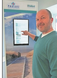
Touchscreen-Technik hat bei Paulus Bäder & Heizung Einzug gehalten.